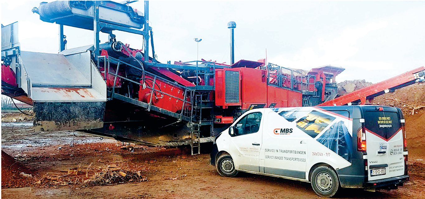
MBS heeft de grote uitvoerband van de GIPO breker vervangen.